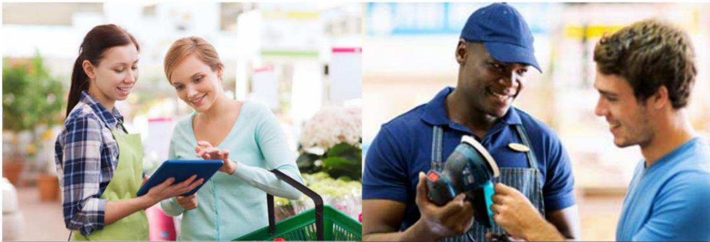
EQUIPIER POLYVALENT DU COMMERCE