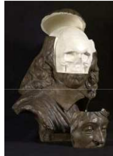
Surmoulage en plâtre de Descartes, XX e siècle. Paris, École nationale supérieure des beaux-arts.

La bibliographie du programme est seulement indicative pour les professeurs, cela leur donner une grande liberté d'analyse !